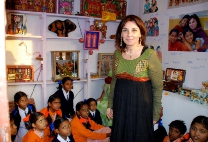
Matildalamora, Feria del libro en enero