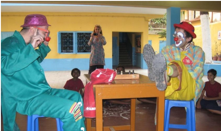
Kolo Kolo y Kili Kili nos visitaron en marzo